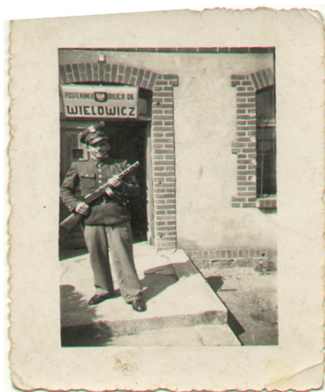
Wielowicz - posterunek milicji obywatelskiej

Ważnym wydarzeniem dla wsi była jej elektryfikacja, która miała miejsce pod koniec lat 50 – tych XX w. Wodociąg w Wielowiczu wybudowano w latach 70 – tych, natomiast na wybudowaniu (Wielowicz – Góry) w połowie lat 90 – tych XX w. W Płoskowie wodociąg powstał w 2009 r.