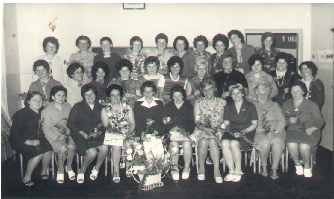
25 lecie KGW Wielowicz (21.09.1974r.)

Koło Gospodyń Wiejskich, jako jednostka organizacyjna Kółka Rolniczego, działa już od 1948 roku i zrzesza kobiety mieszkające we wsiach Wielowicz, Szynwałd i Płosków. Obecnie liczy 30 członkiń (grudzień 2015r.). Co roku KGW organizuje spotkania m.in. z okazji: Dnia Babci, Dnia Kobiet, Dnia Matki i Dziecka, spotkania opłatkowe połączone ze śpiewaniem kolęd, jasełkami itp. Ponadto organizowane są festyny na świeżym powietrzu, a także wieczorki taneczne.