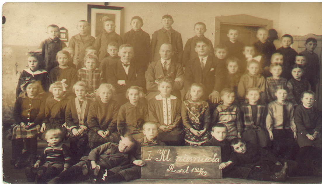
Klasa niemiecka – rok szkolny 1928/1929 (w budynku szkolnym w Szynwaldzie – od 2015r. „Dom seniora”)

16 maja 1837 roku w godzinach nocnych szalał w Wielowiczu straszliwy pożar, który pochłonął trzy istnienia ludzkie, zaś ośmiu mieszkańców doznało ciężkich poparzeń. Ponadto pożar pochłonął 6 domów, 4 stodoły i 8 obór, spaliło się przy tym 13 koni, 61 szt. bydła, 360 owiec i 500 korców zboża.