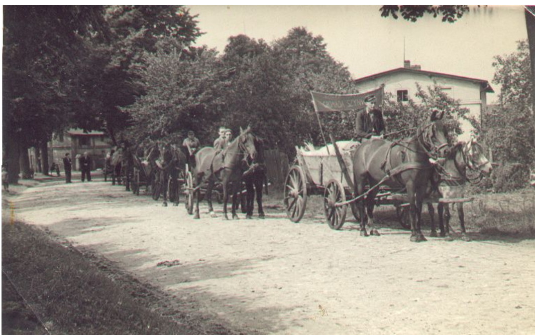
Płósków – koniec lat 40-tych XX w.(obowiązkowe dostawy zbóż)

Wielowicz w okresie międzywojennym był stolicą gromady (gminy), podobnie jak po II wojnie światowej. Funkcjonowała tutaj Gromadzka Rada Narodowa jako przedstawicielstwo ówczesnej władzy ludowej (obecnie nieruchomości nr 27) oraz milicja (obecnie nieruchomości nr 21 i później nr 34). W skład gromady Wielowicz weszły wsie: Szynwałd, Wielowicz (z Roztokami), Rogalin i Płósków. 1 stycznia 1969 r. uległa likwidacji gromada Wielowicz, która włączona została w całości do gromady Sośno, a od 1 stycznia 1973 roku Płósków i Wielowicz wchodzi już w skład gminy Sośno, powstałej z połączenia gromady Sośno i Wąwelno.