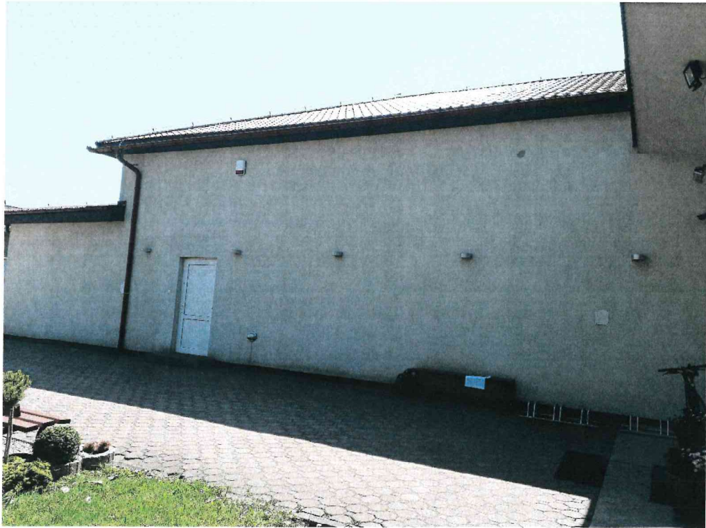
Zdj. 4. Elewacja zachodnia