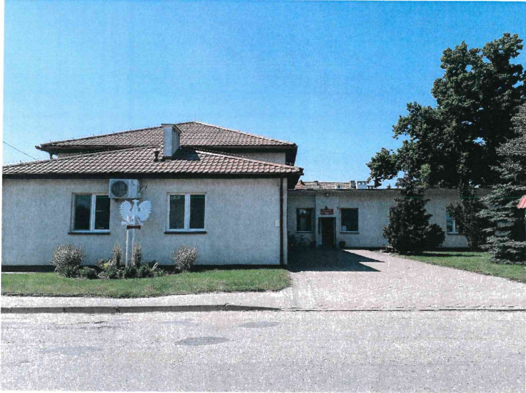
Zdj. 1. Elewacja północna (frontowa)