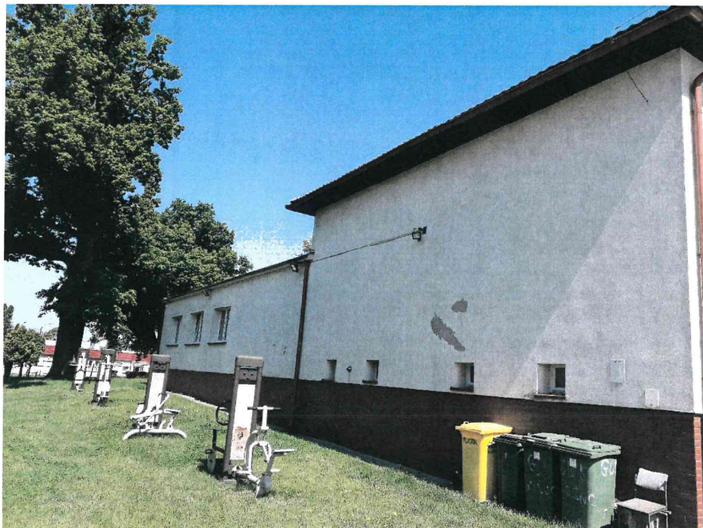
Zdj. 5. Elewacja południowa