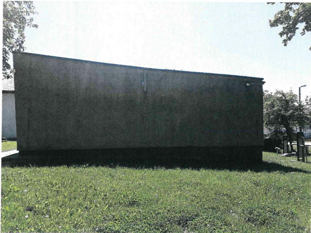
Zdj. 3. Elewacja zachodnia