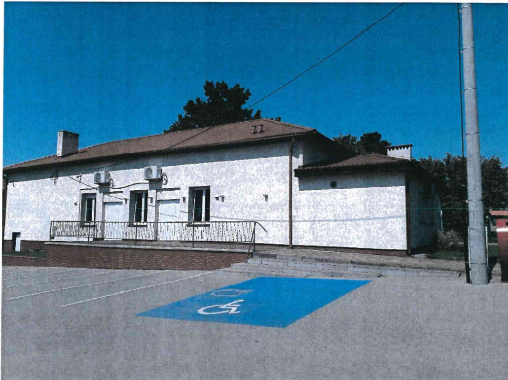
Zdj. 6. Elewacja wschodnia

STAROSTA SEPOLEŃSKI ul. Kosciuszki 11 89-400 Sępólno Krajeńskie